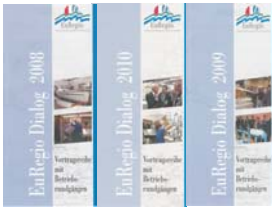
EuRegio-Dialog (4 - 6 x jährl. bei Betrieben der EuRegio)