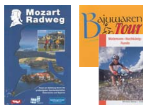
Radwege: Familien, Erlebnis, Mountainbike