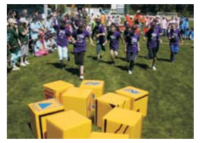
Kindersicherheitsolympiade (jährlich, seit 2007)