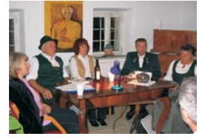
Mundartleseabend "Bald hinum, bald herum" (jährlich.)