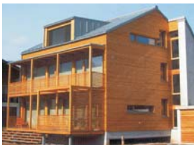
Holzforum/-dialog, ligneum (ca. 2 x jährl.)