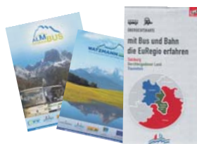
AlmErlebnisBus, Watzmann Express, ÖPNV-Karte