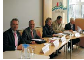
EuRegio-Naturschutzfachtagung ( alle 2 Jahre)