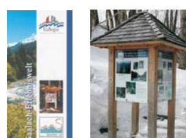
Saalacherlebniswelt mit 16 Gemeinden

Museumskooperationen: Leogang / Teisendorf Henndorf / Siegsdorf Waging / Salzburg Laufen / Salzburg Tittmoning / Neumarkt a.W. Abwasserkooperationen: Laufen / Oberndorf Ainring / Wals-Siezenheim Schneizreuth / Unken