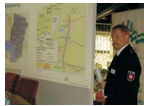
EuRegio-Sicherheitssymposium (alle 2 J., seit 2009)