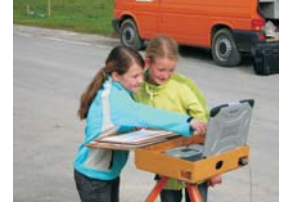
EuRegio-Girls`Day (jährlich, seit 2004)