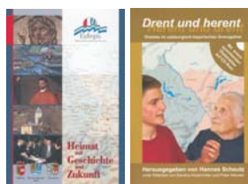
EuRegionale Geschichte und Mundart