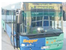
Eilbuslinie 24 Freilassing - Salzburg