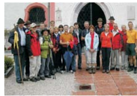
Bürgermeisterwanderung (jährlich, seit 1998)