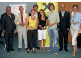
EuRegio-Sommerakademie (jährlich, seit 2006)