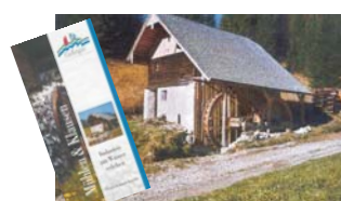
Sanierung von Mühlen und Klausen