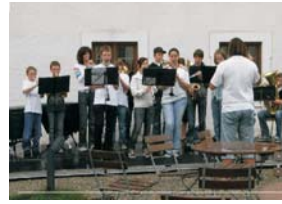
EuRegio-Musikschulfest (alle 3 Jahre, seit 2000)