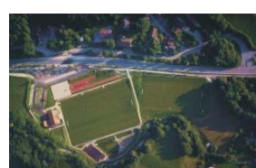
Sportanlage Bayerisch Gmain / Großgmain