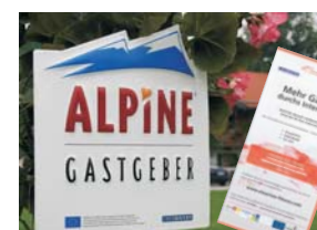
Alpine Gastgeber, Etourism-fitness