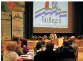
EuRegio-Rat (2 x jährl., Seit 1996)