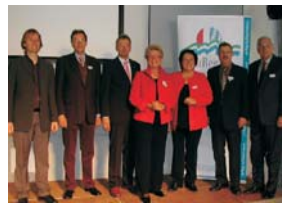
EuRegio-Forum Integration (alle 2 Jahre, seit 2006)