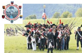
Frieden Schützen 1809 - 2009