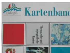
EuRegio-Kartenband, EuRegionale Raumanalyse