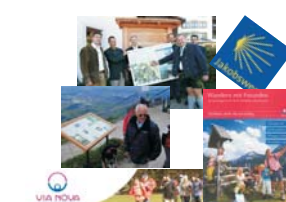
Pilger- und Wanderwege Vorland bis Hochgebirge