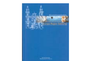
Wirtschaftsstandort Europa-Region Salzburg