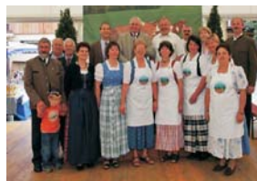
Hoffeste und Erntefeste (jährlich, 2005 - 2007)