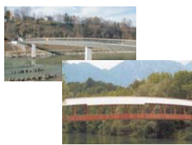
Europasteg Laufen/Oberndorf Steg Ainring/Wals-Siezenheim.