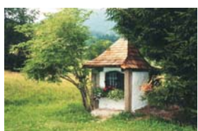
Klein-/Flurdenkmäler: Dautenbank mit 30 Gemeinden